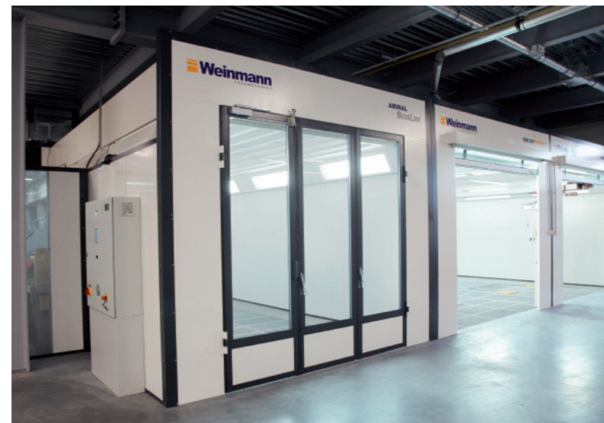
La façade de la cabine Amiral Blueline composée d'une porte d'accès à 3 battants et constituée de tôles prélaquées et de cadres en profilés.

La réputation dont bénéficie l'entreprise n'est pas un hasard; elle est liée à la robustesse, la grande technicité des produits et ses nombreuses innovations nichées entre autres dans cette cabine Amiral Blueline. À elle seule, celle-ci rassemble les meilleures technologies en termes de confort d'utilisation et d'économie d'énergie. Une cabine de peinture est une source importante de dépenses énergétiques dans un atelier, principalement lors des phases de pistolage où l'apport en air neuf est de 100%. Weinmann Technologies a alors mis au point le système EcoVario, une exclusivité de l'entreprise. Fonctionnant en mode intelligent, la cabine sait détecter si l'opérateur est en train de peindre ou non. À la première seconde où le peintre agit sur son pistolet, la cabine bascule instantanément en pleine puissance, garantissant ainsi les vitesses d'air requises pour l'évacuation des solvants et la sécurité de l'opérateur. Le système EcoVario, implantable sur tout type de cabine de peinture, est donc automatiquement asservi aux besoins du peintre sans intervention humaine. À la clé: une économie en dépense d'énergie (électricité ou gaz) de